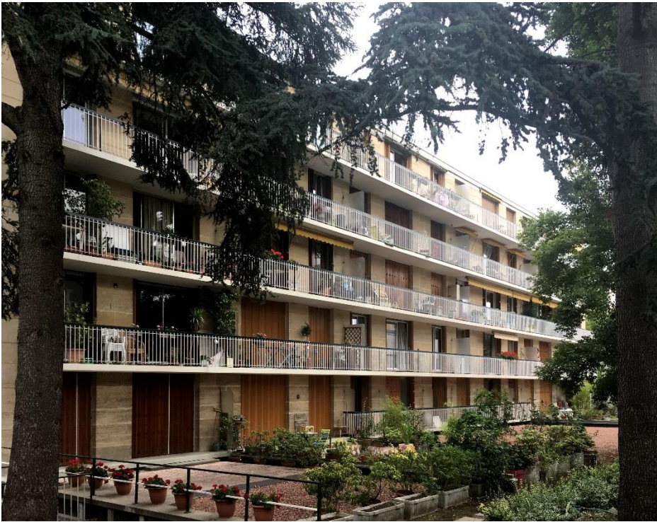
État 2018. Façade de l'immeuble sur cour.