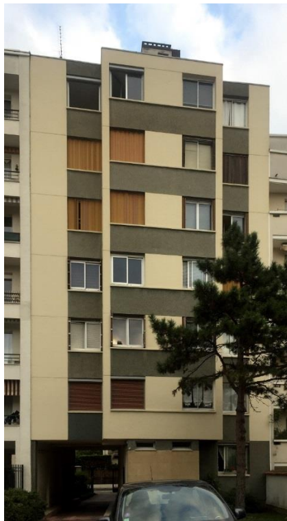
État 2018. Façade sur cour de l'immeuble sur rue.