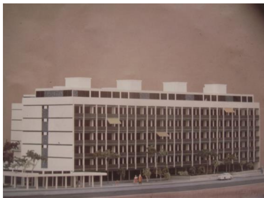
Photos de la maquette.

C'est un ensemble d'appartements. Je ne sais pas pourquoi on a indiqué « chambres de bonne », je suis très étonné. Nous avons dû appeler chambres de bonne de petits studios, ou alors des chambres que nous rajoutions à côté d'un appartement pour que les occupants disposent d'un petit studio, qui pouvait être joint à leur appartement, ou isolé pour y loger des personnes âgées ou leurs parents. On l'a fait dans d'autres circonstances.