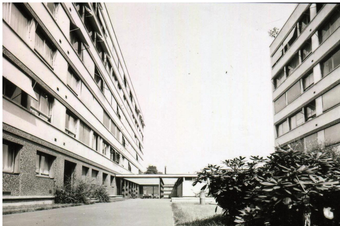
Vue de la cour intérieure. Photo d'époque.