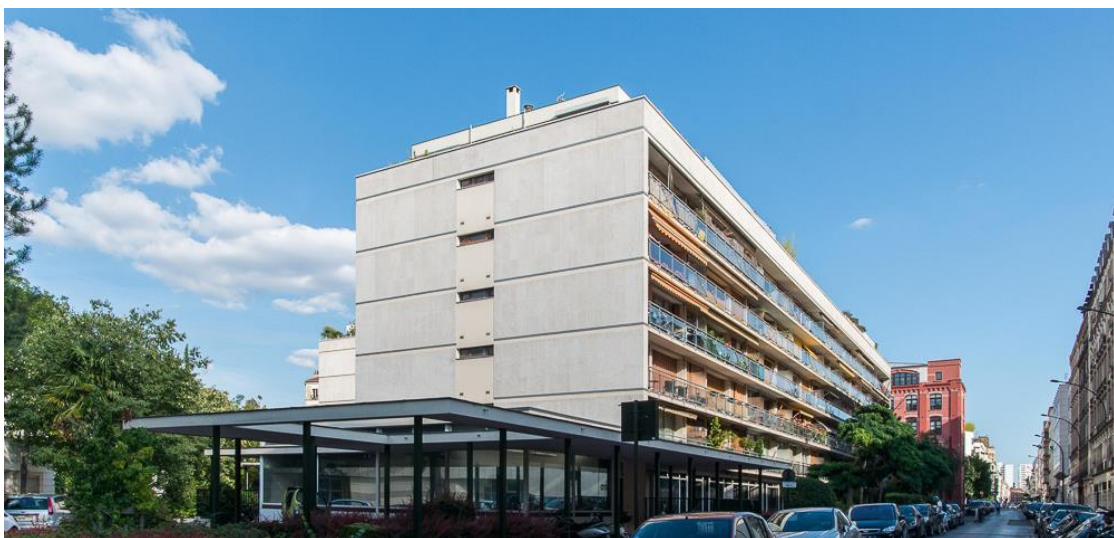
État 2017.