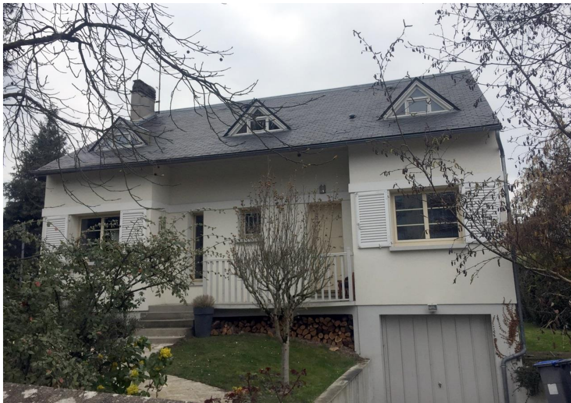
État 2019. Façade d'un pavillon.