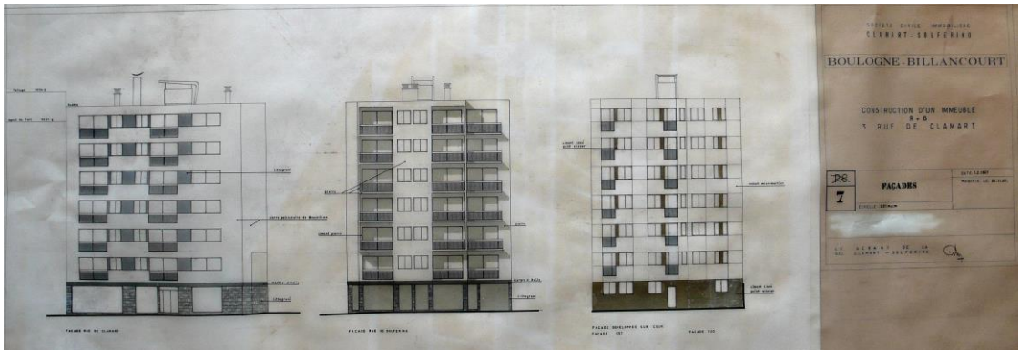
Façades, calque. Fonds Lesné-Bernadac.