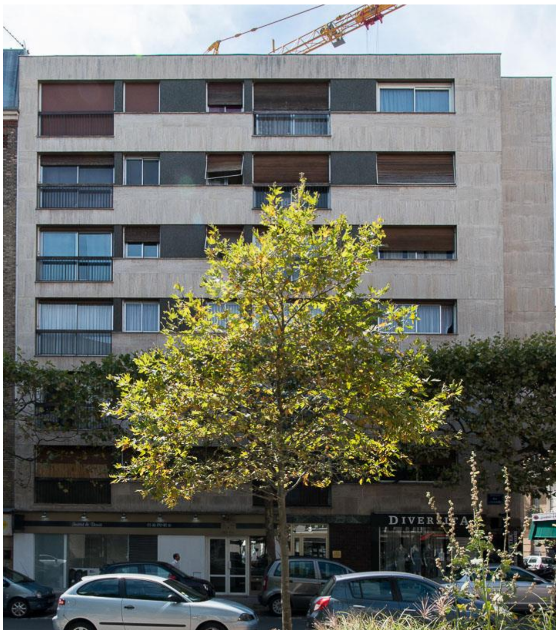
État 2017.