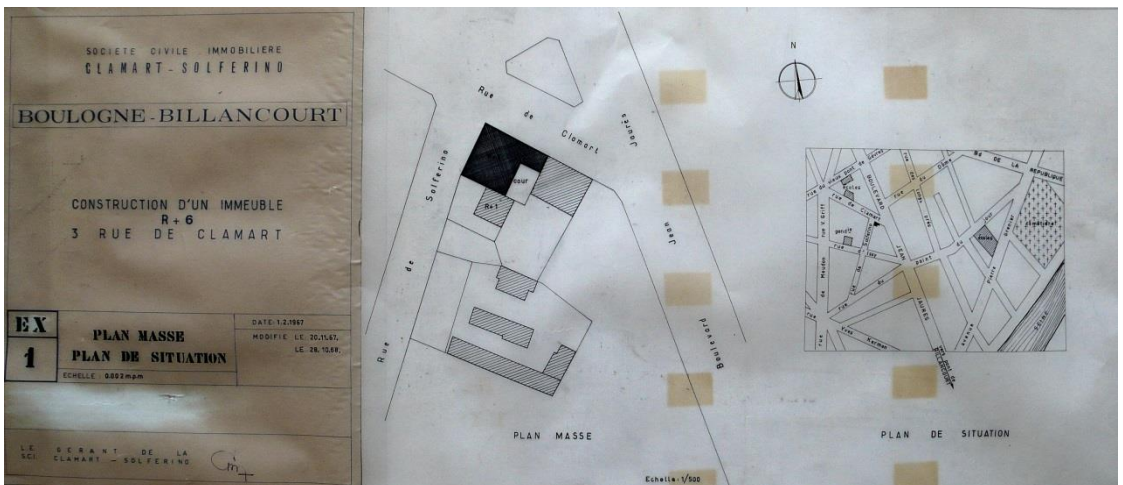
Plan de masse et de situation, calque. Fonds Lesné-Bernadac.