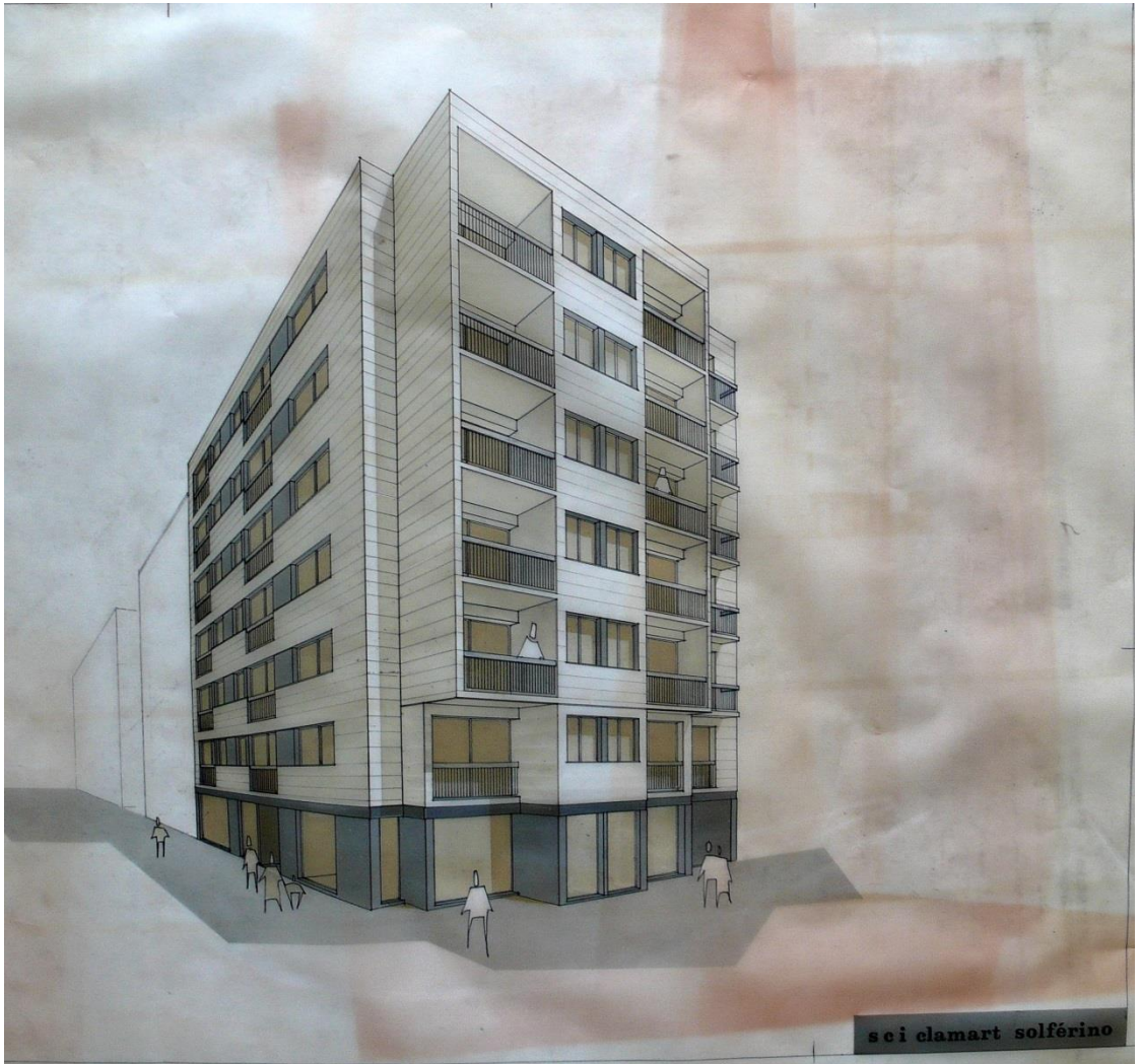
Perspective, calque. Fonds Lesné-Bernadac.