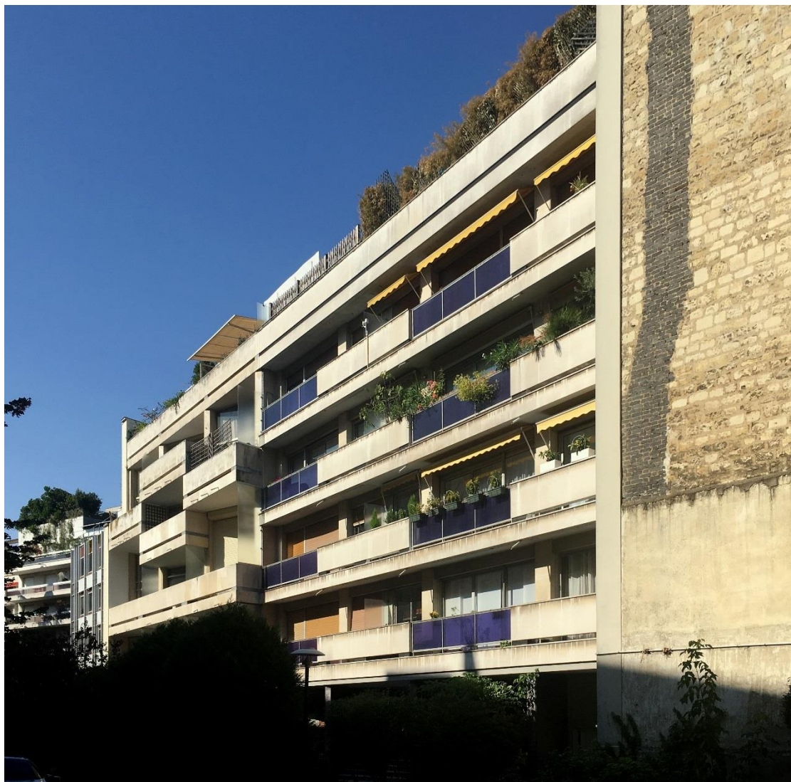
État 2018. Vue de la façade (au premier plan).