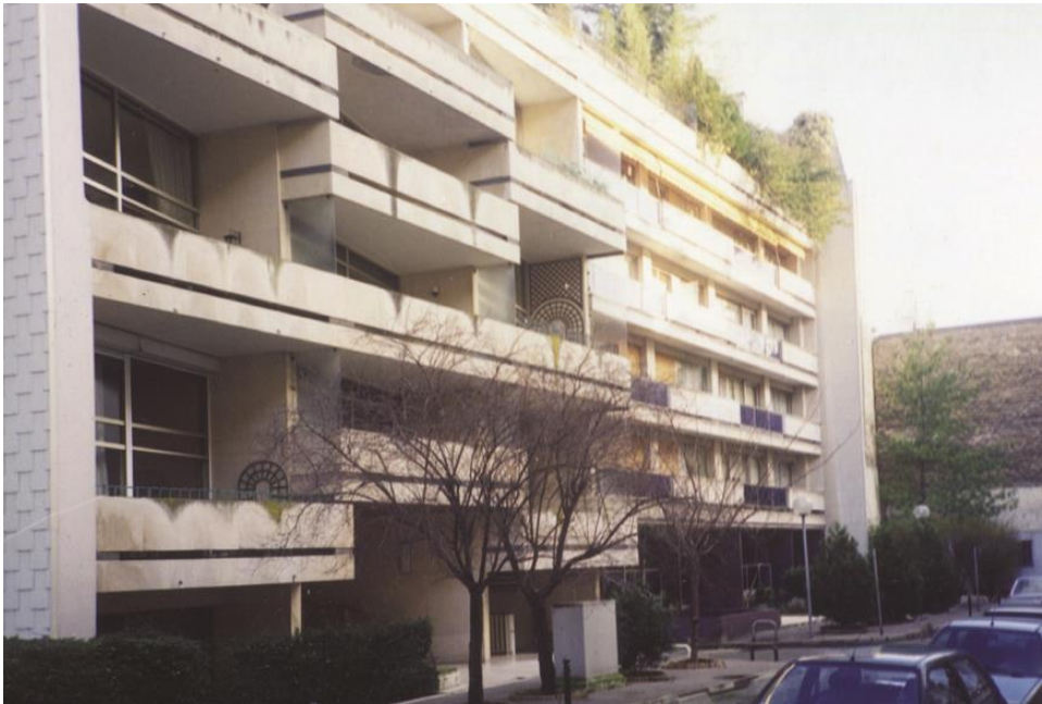
Photo d'époque. Immeuble au deuxième plan.