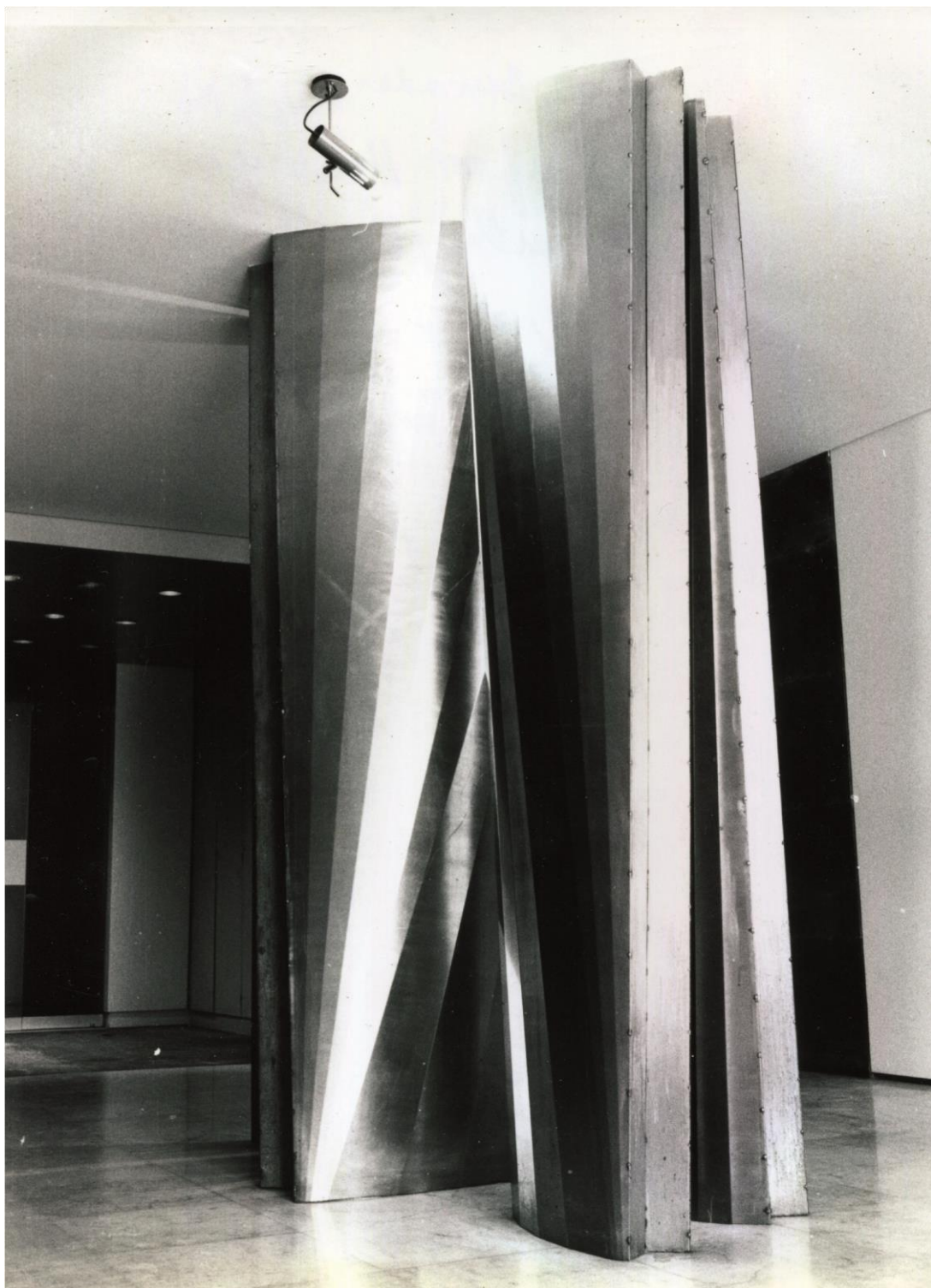
Hall d'entrée, photo d'époque.