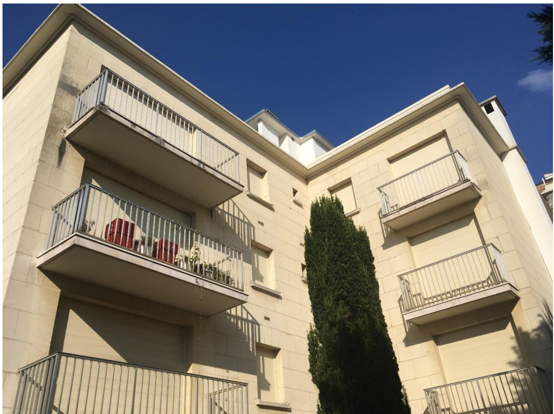
État 2018.