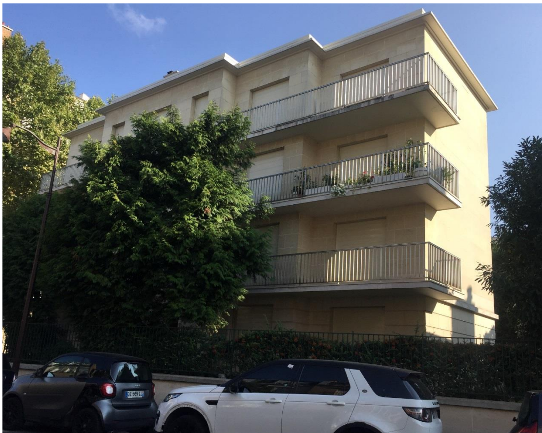
État 2018. Façade principale.