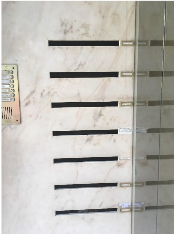
État 2018. Détail de l'entrée.