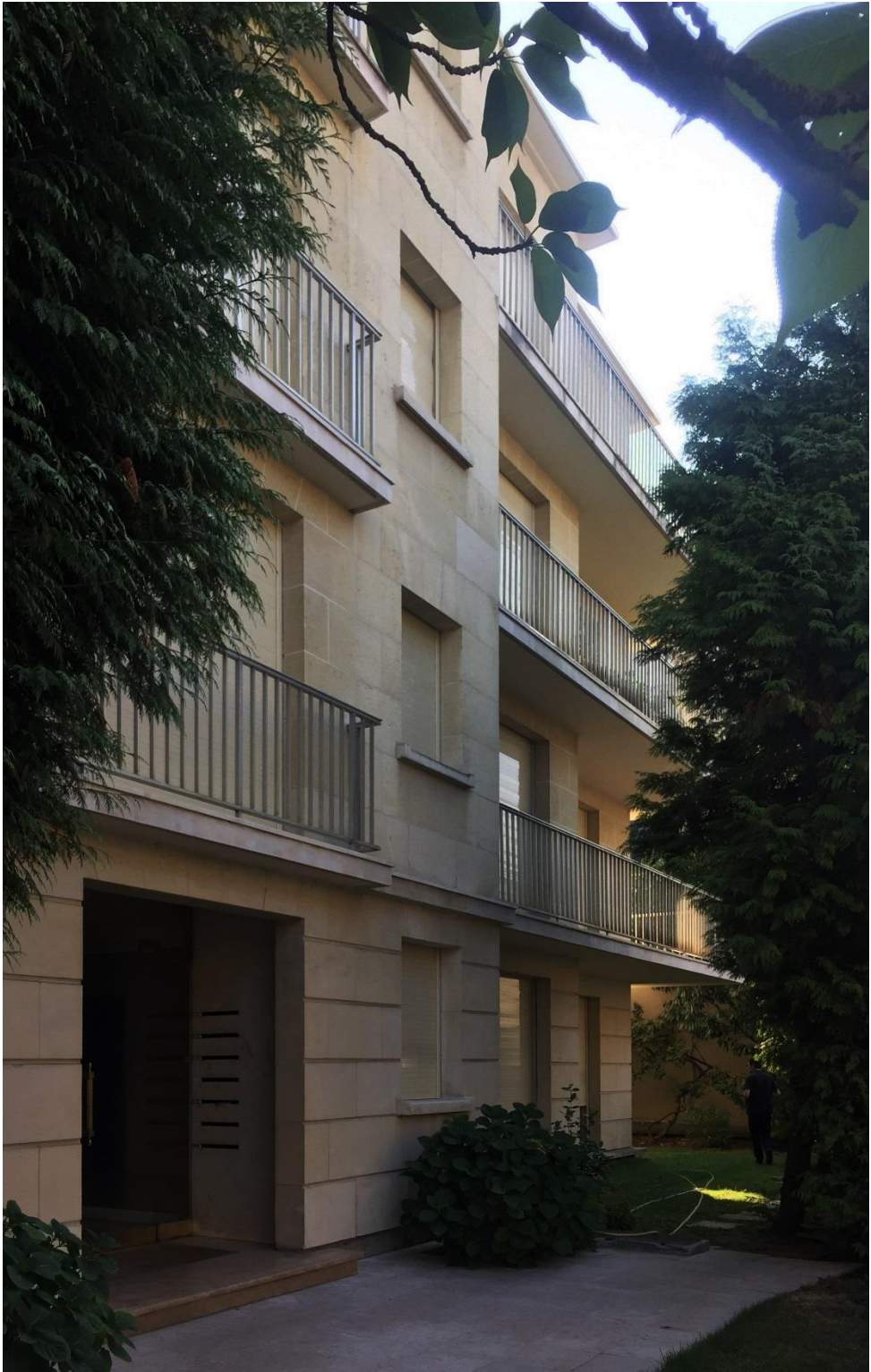
État 2018.