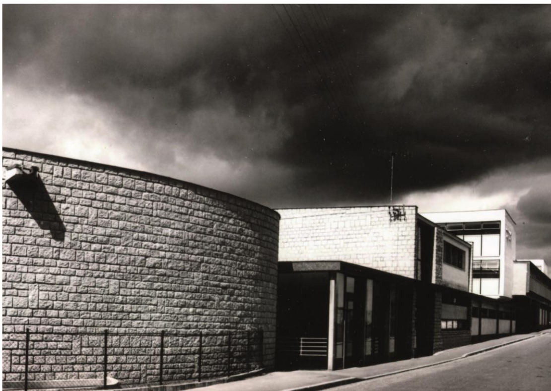
L'école maternelle.