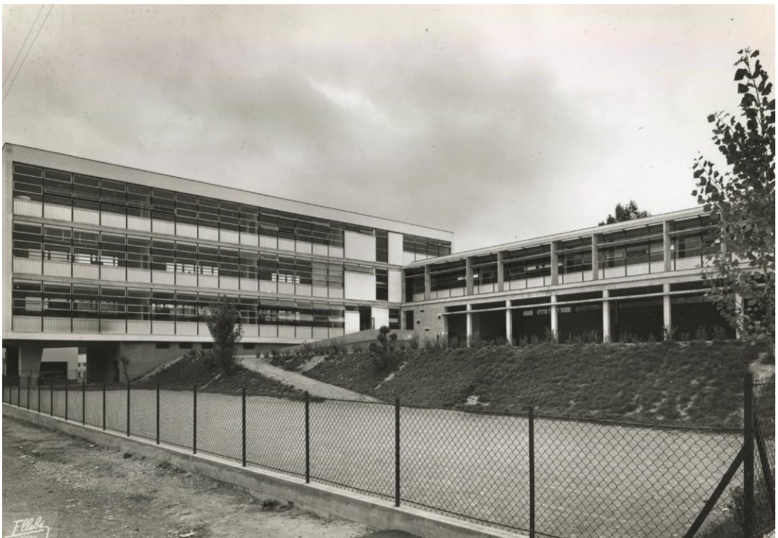
Photos d'époque.