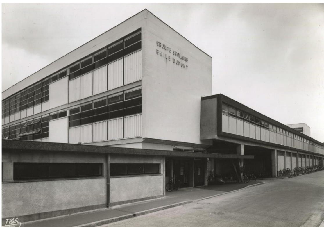
Photo d'époque.