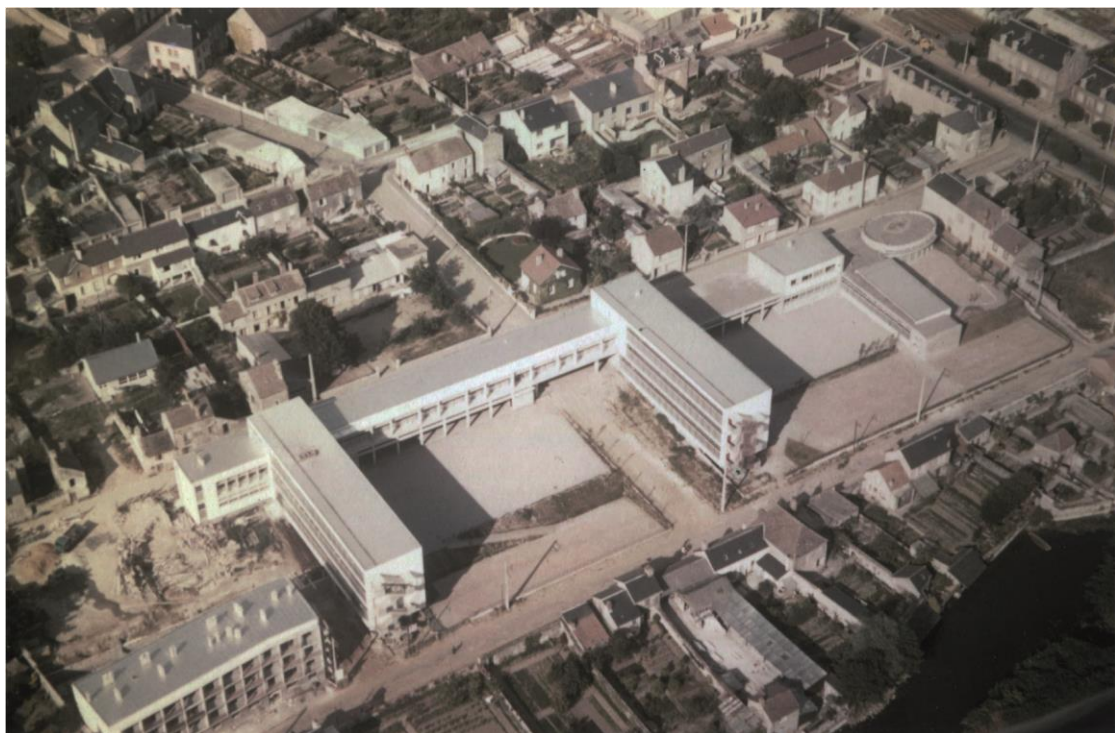
Vue aérienne, septembre 1961.

1. Daniel Mikol (1923-2014) est surtout connu pour la réalisation de tours de logements dans le quartier de la place d'Italie à Paris (tours Chambord, Jade, Béryl, Rubis, etc.).