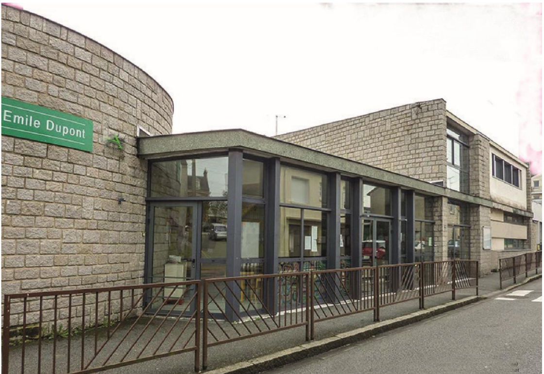
L'école maternelle en 2016.

René Letourneur (1898-1990), sculpteur académiste, a réalisé au titre du 1% artistique, deux bas-reliefs en bronze qui étaient installés de part et d'autre des trois piliers en béton qui supportaient l'auvent d'entrée du groupe scolaire. L'un des personnages tient dans sa main un flambeau et un livre, l'autre porte une pierre sous son bras. Ci-contre, les gabarits en contreplaqué dans l'atelier du sculpteur.