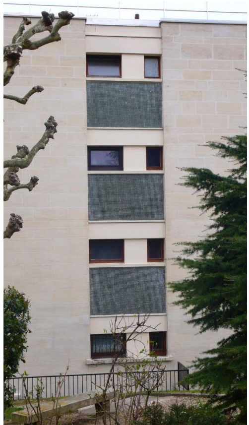
État 2019. Détails des façades.