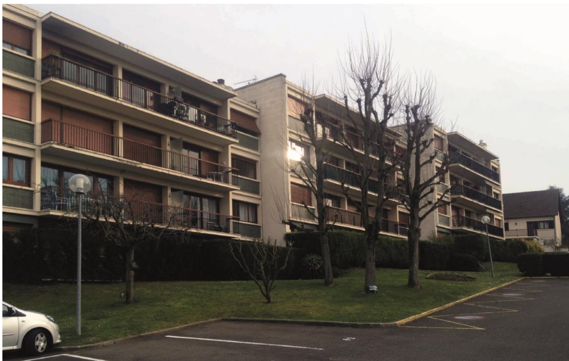
État 2016.

Type de construction : ensemble résidentiel.