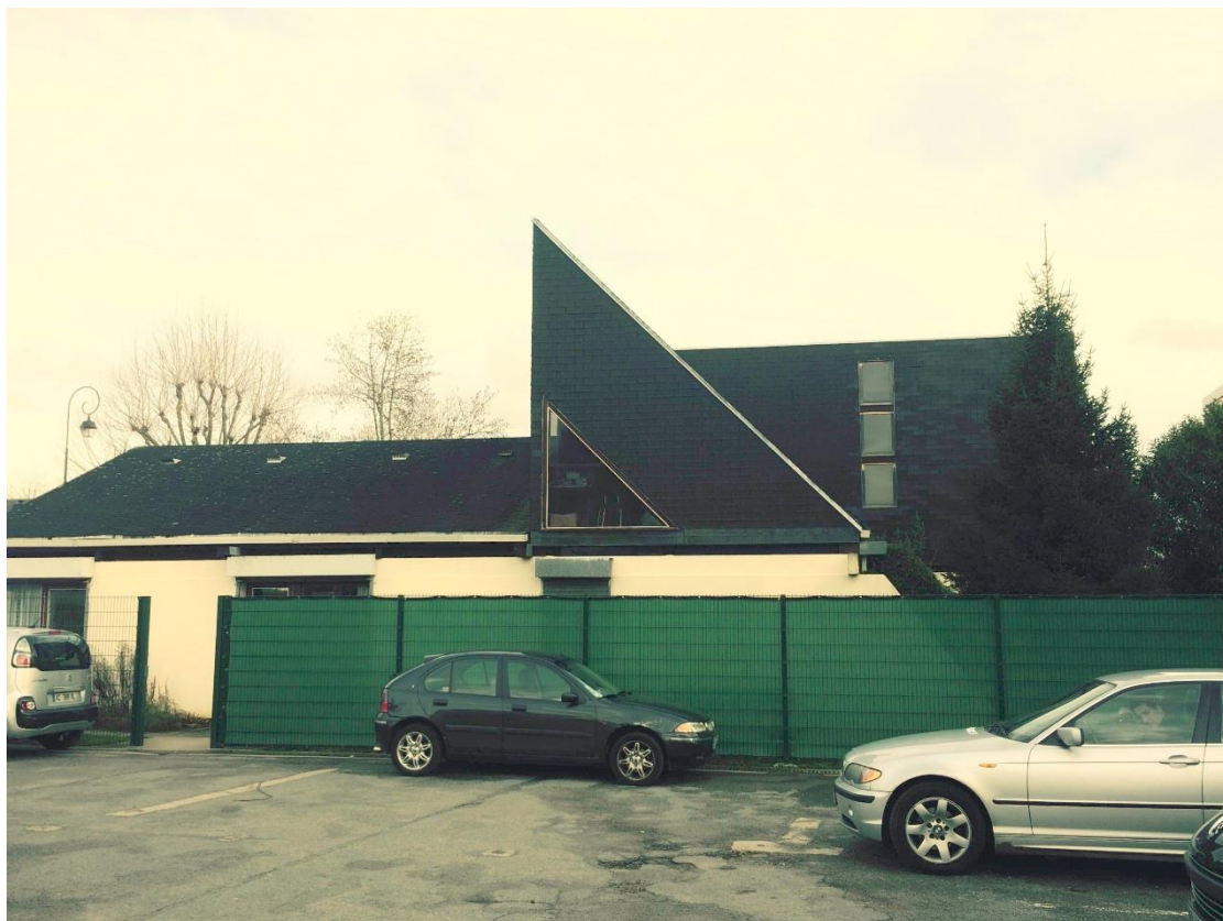
État 2016. Façade sur le parking.

Type de construction : centre de loisirs.