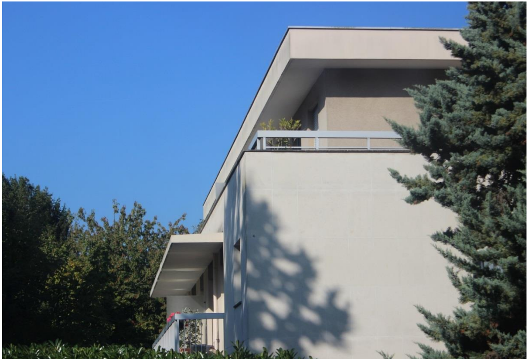
État 2016. Détail de la façade est.