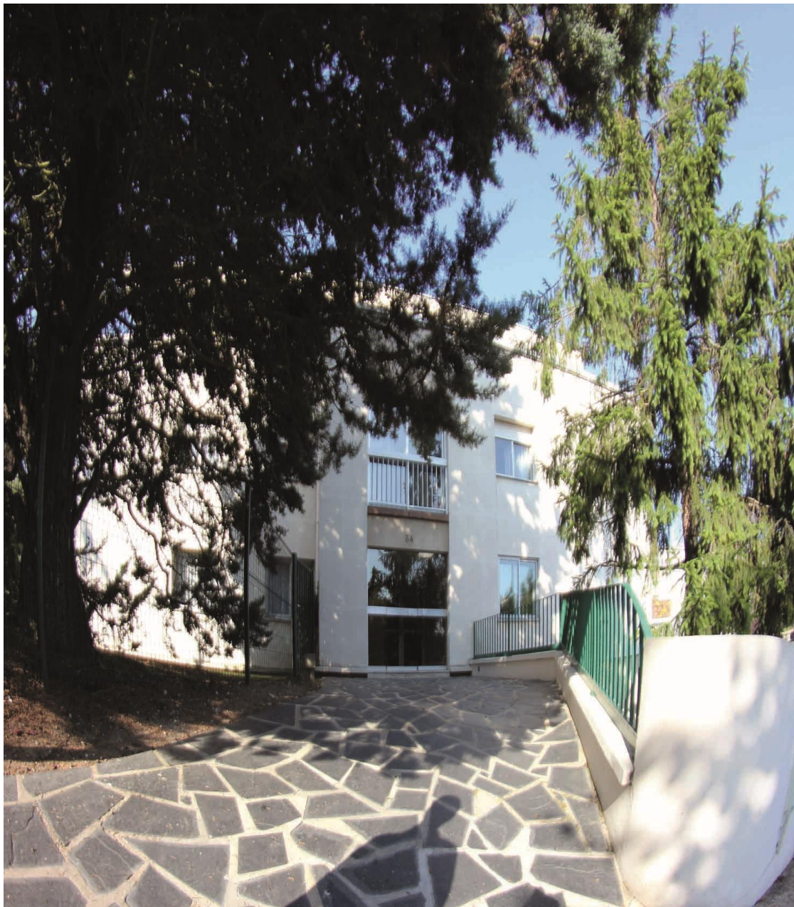
État 2016. Entrée de l'immeuble.