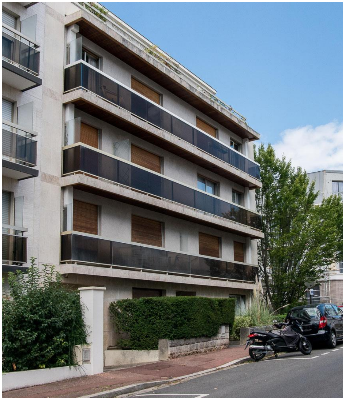
État 2017. Les balcons en verre fumé de la façade.