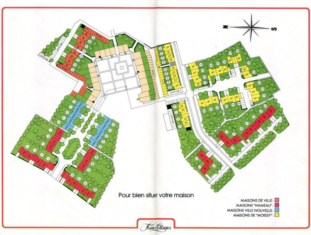
Plan de masse. Brochure de promotion. Fonds Lesné-Bernadac.