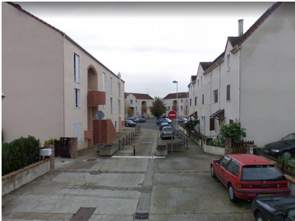
Le centre du quartier. État 2019.