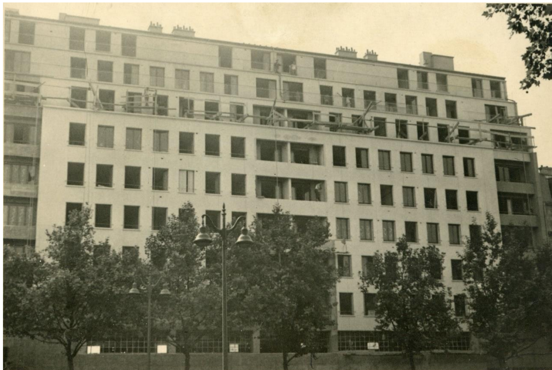
Façade boulevard Berthier. Photo de chantier.

Type de construction : logements et garage automobile.