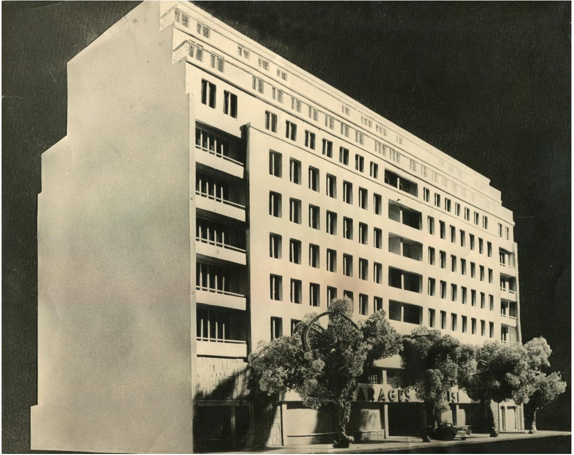
Maquette. Fonds Lesné-Bernadac.