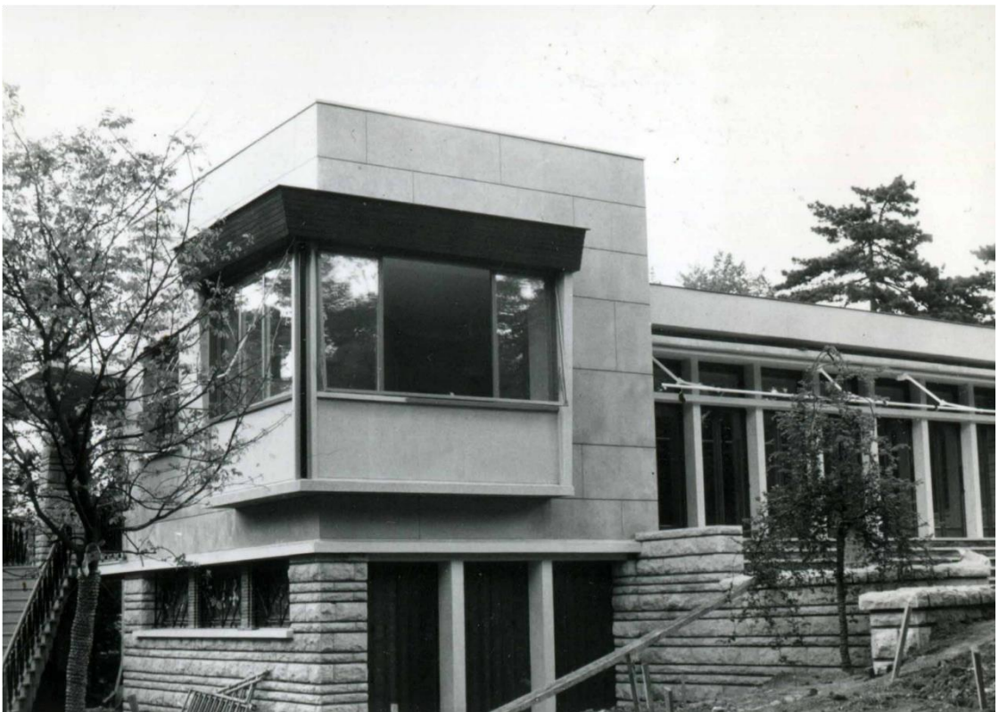
Photo de chantier.