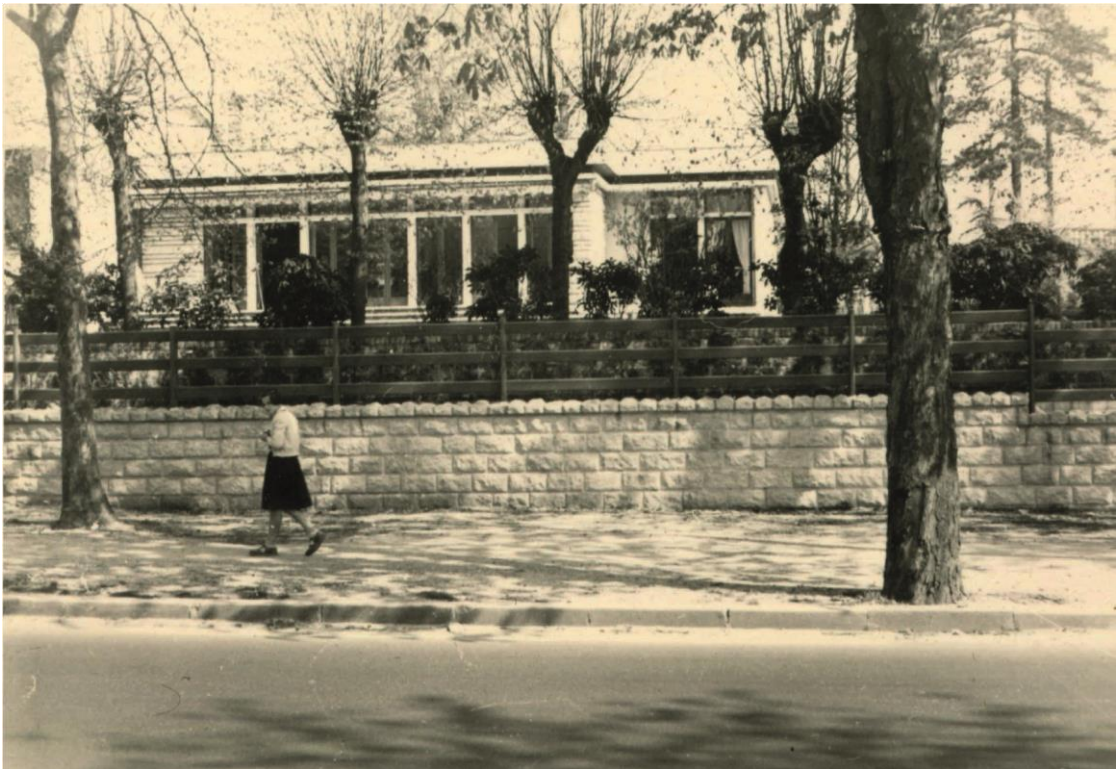
Photo d'époque.