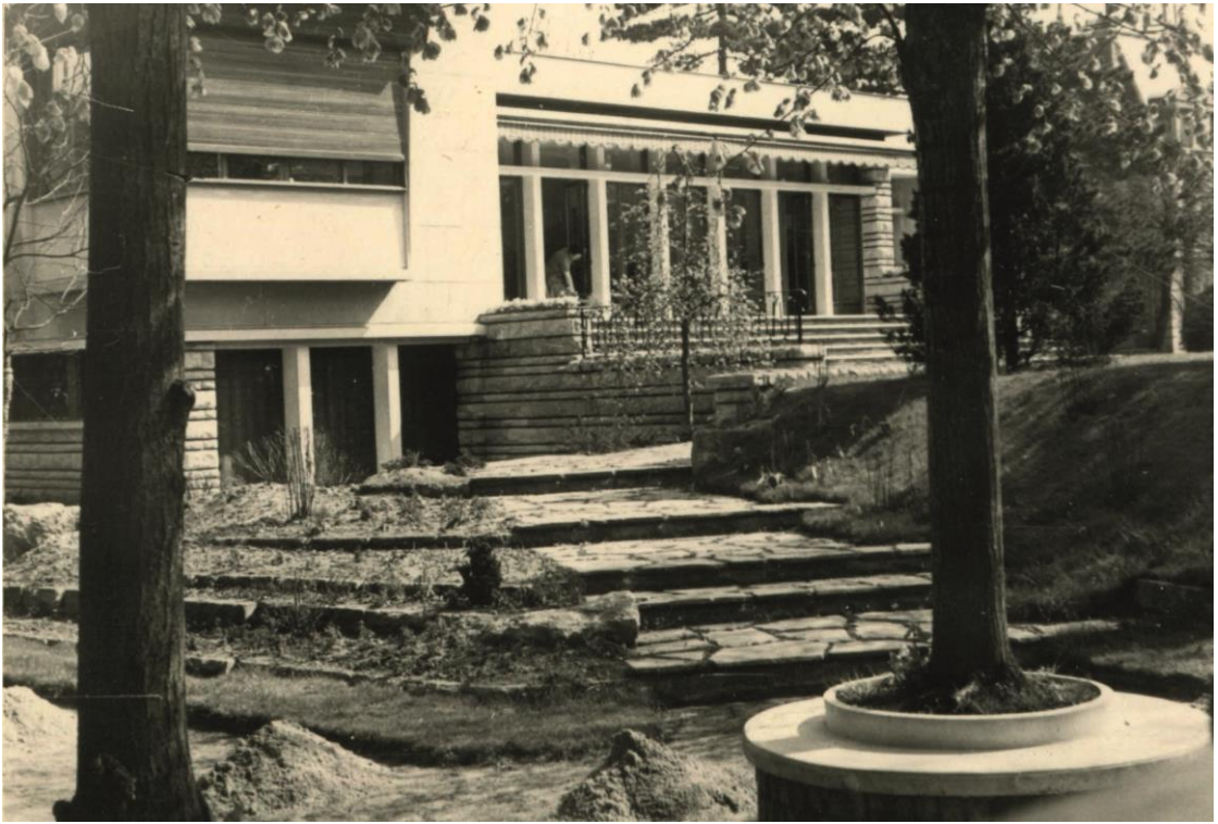
Photo de chantier.