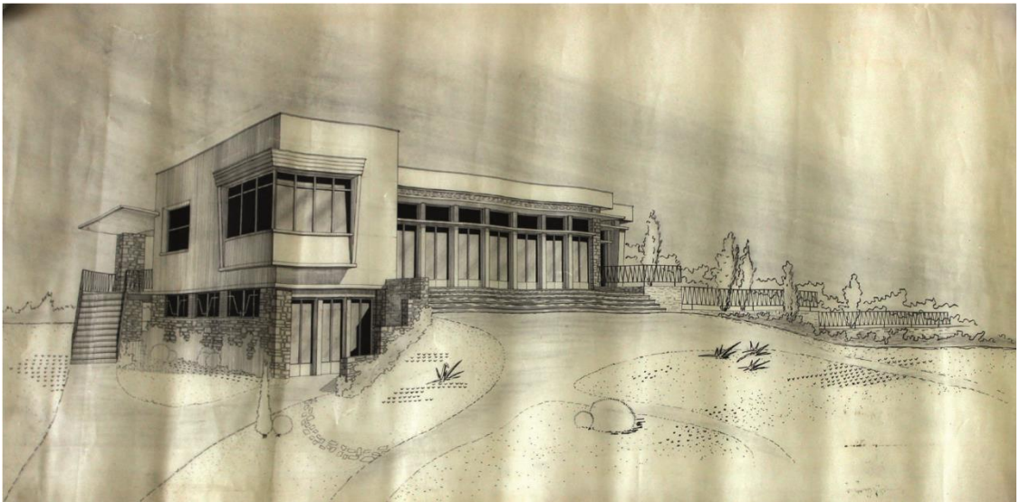
Perspective avec les jardins, calque.