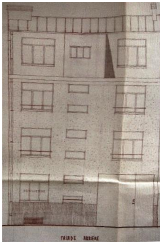
Plans des façades avant et arrière.