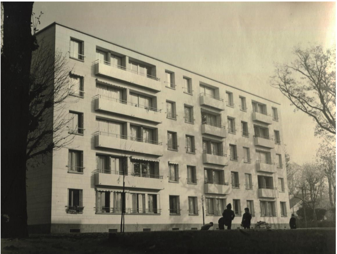
Photos d'époque.