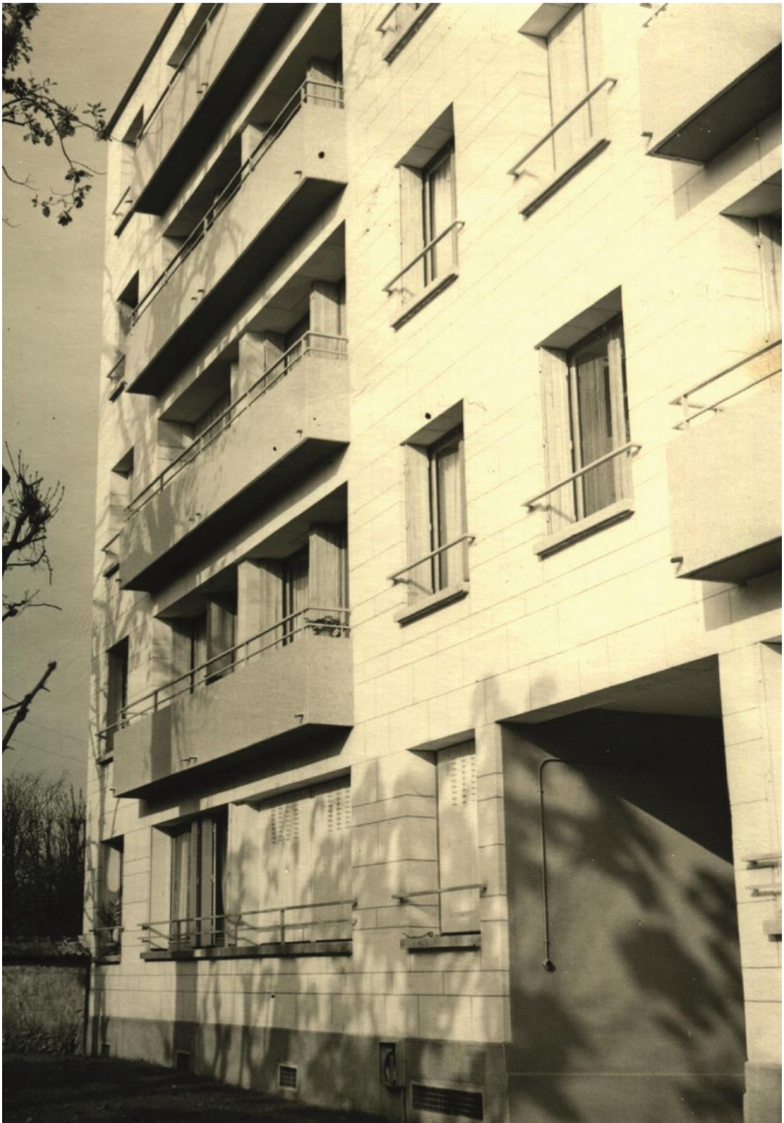
Photo d'époque.