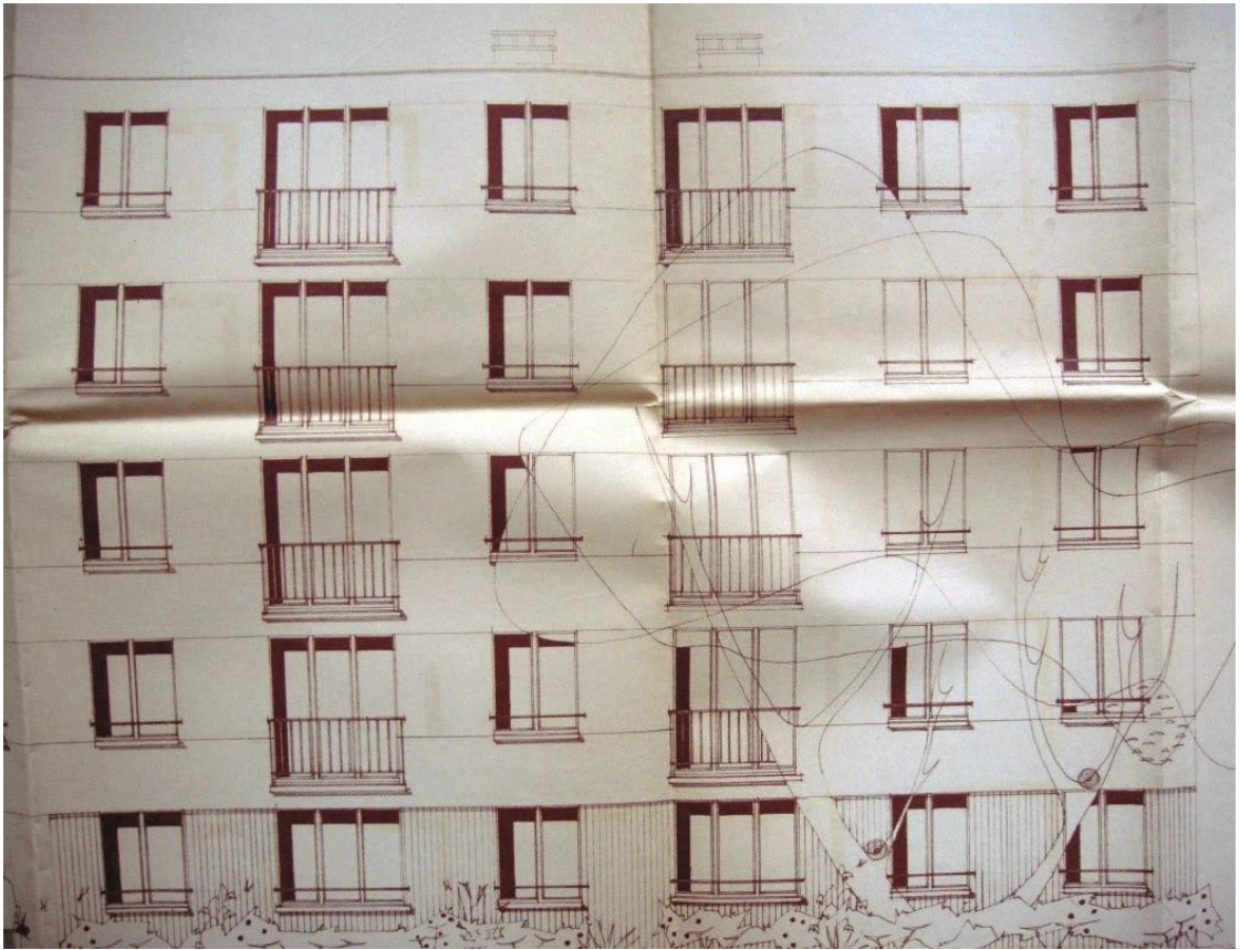
Plan de façade.