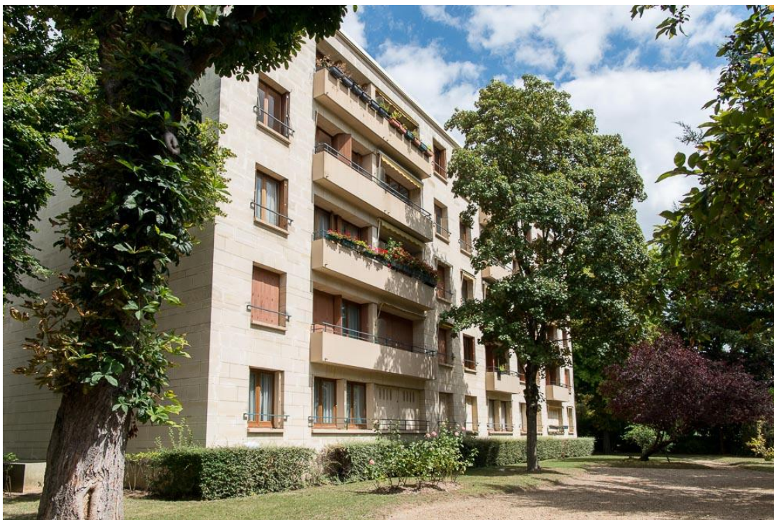
État 2017.