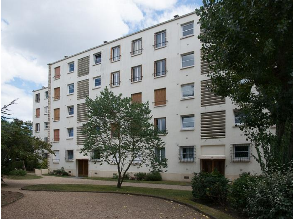
État 2017. Façade sur jardin.