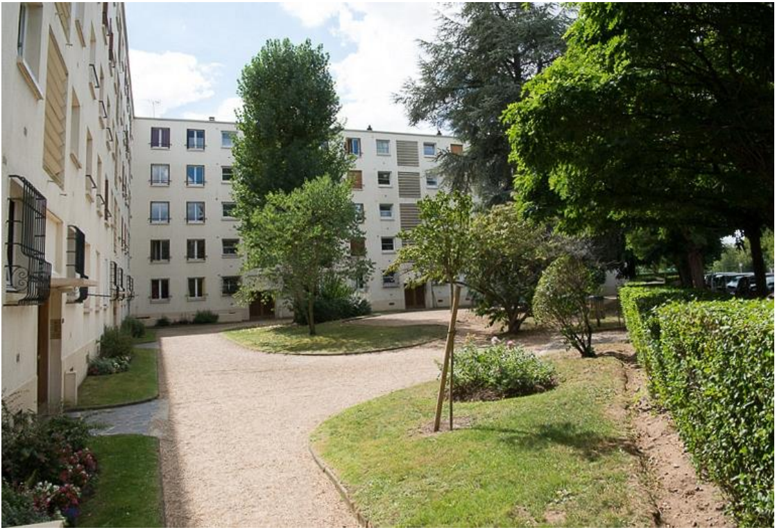
État 2017.