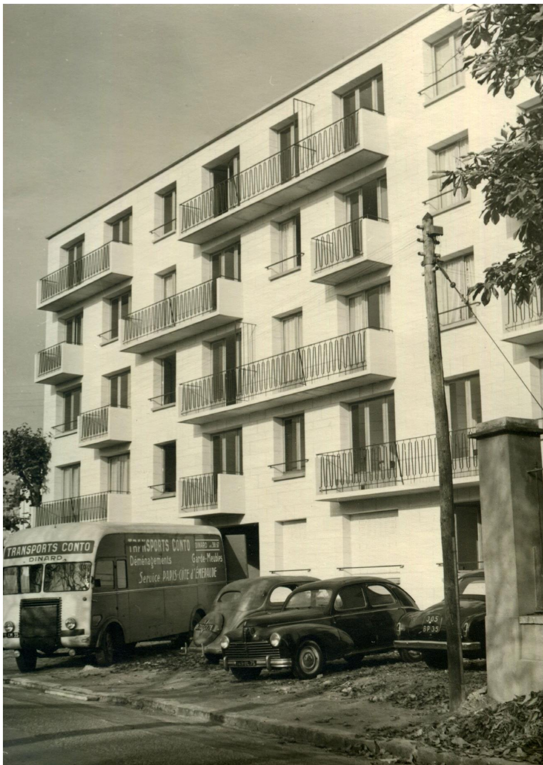
Photo d'époque.