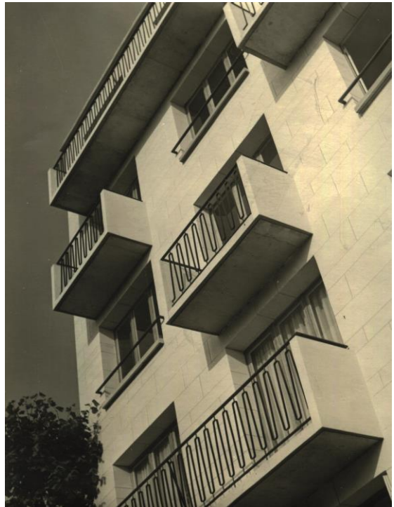
Photos d'époque.

Une jolie petite opération réalisée avec la prime à 500 francs (voir notice 35 ). L'immeuble est bien équilibré, et très typique. On peut aimer ou ne pas aimer, mais c'était du style Lesné-Bernadac tout craché 1 .