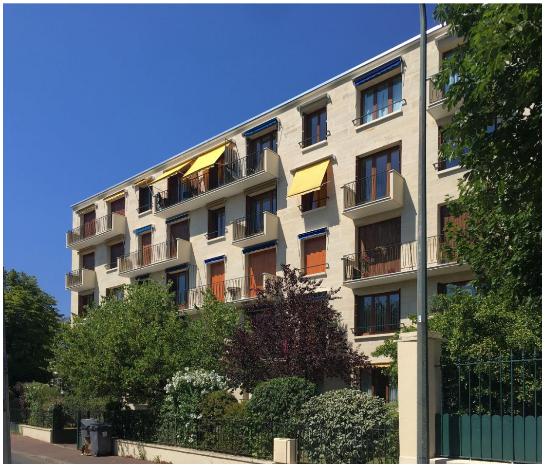
État 2019.