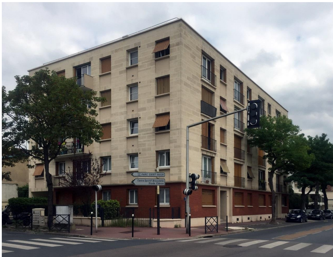
État 2018.