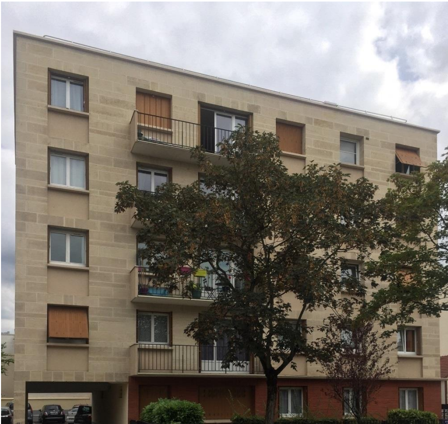
État 2018.

Je me souviens très bien de cette affaire parce que je me suis souvent rendu souvent sur le chantier. Tout d'abord, bien entendu, on a fait des essais de sol, pour savoir sur quoi on allait bâtir, et là, on savait qu'il y avait un sol difficile. Je suis allé sur place plusieurs fois par semaine, pour examiner le terrain, qui était argileux, assez pentu, et qui posait des problèmes de fondation difficiles. Quand il fait très chaud, la glaise sèche, son volume change et l'immeuble se met à travailler. Nous avons, bien sûr, des ingénieurs pour nous conseiller, mais nous avons aussi Masocco, un entrepreneur avec qui nous avons beaucoup construit. Cet Italien était arrivé en France les mains vides, aujourd'hui il roule en Maserati.