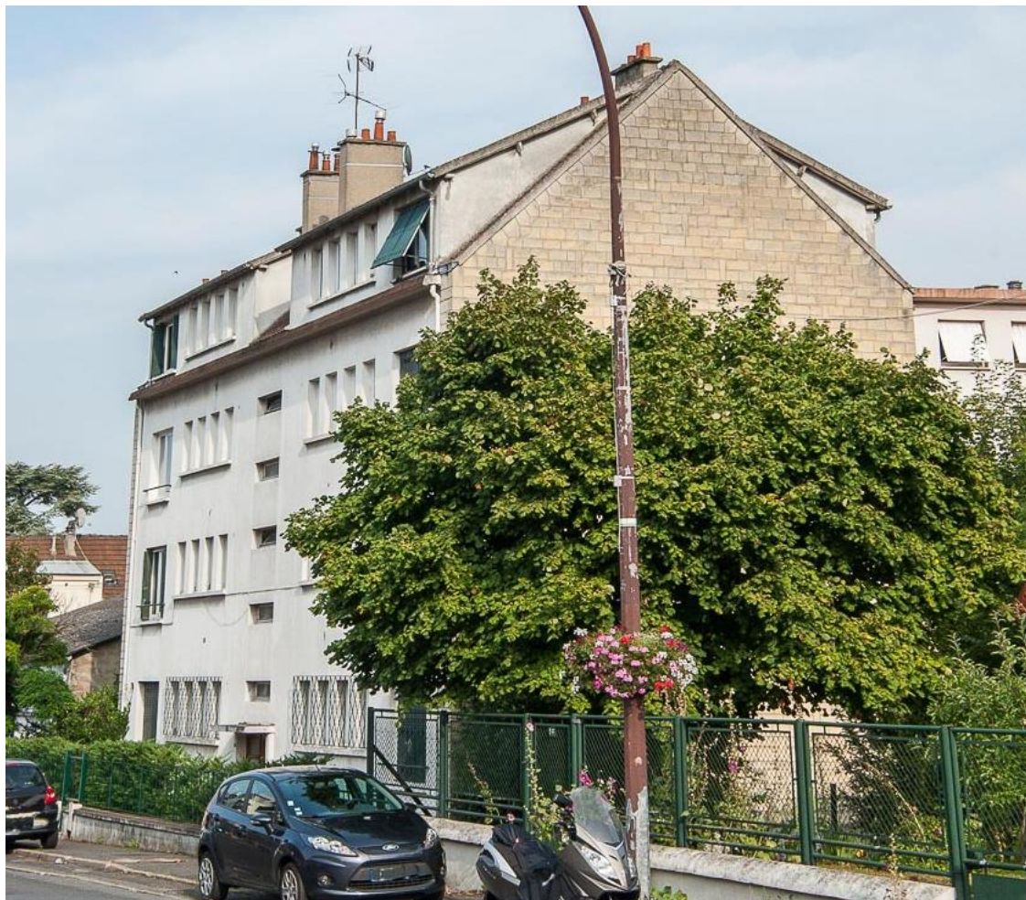
État 2017.