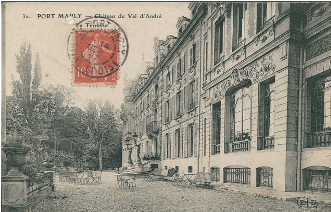
Carte postale. L'ancien château du Val-André sur le terrain duquel a été construit l'immeuble.

Au milieu du XIX e siècle, des carriers venus de Meudon ouvrent les carrières des Montferrands et creusent des galeries pour exploiter la craie destinée à la production de blanc d'Espagne. Dans les années 50, pour faire face à l'explosion démographique, les grands espaces immobiliers remplacent les zones industrielles et les espaces verts, dont le parc du château du Val André.