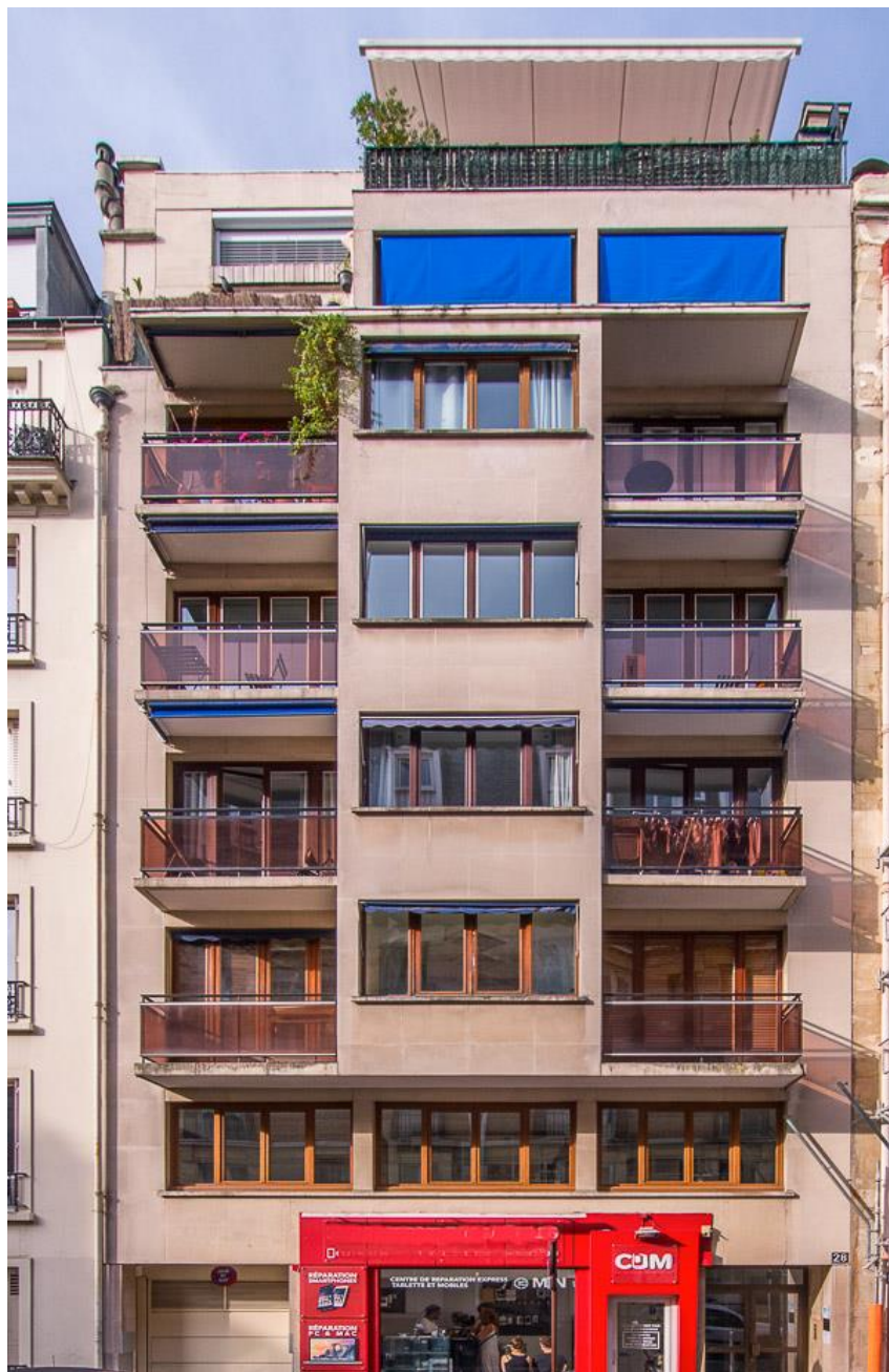
État 2017.