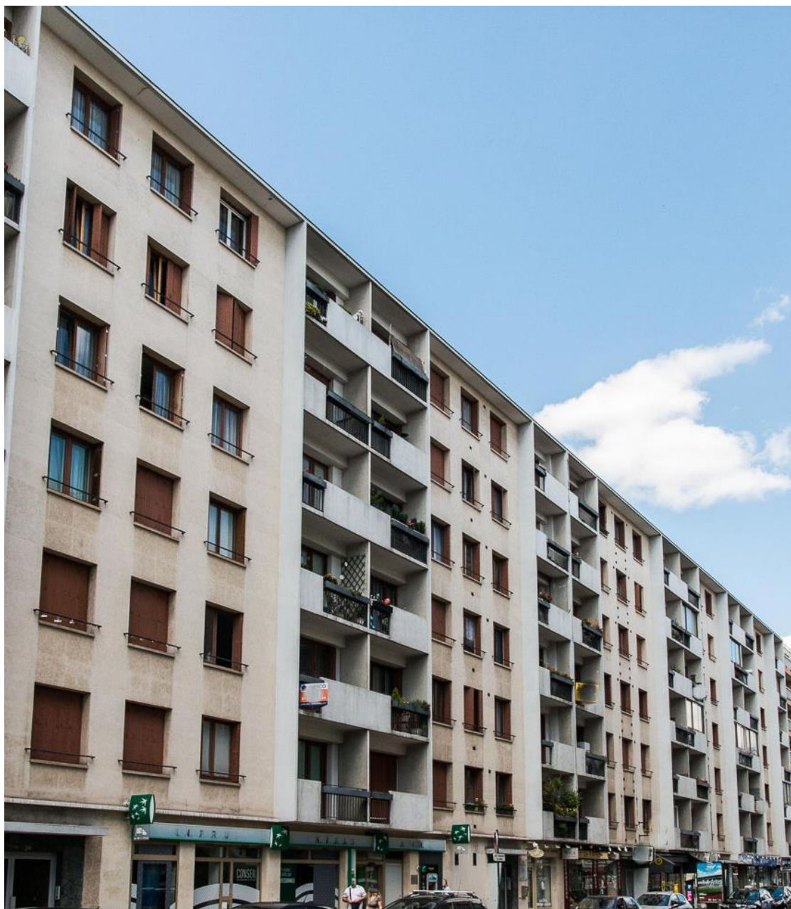
État 2017.