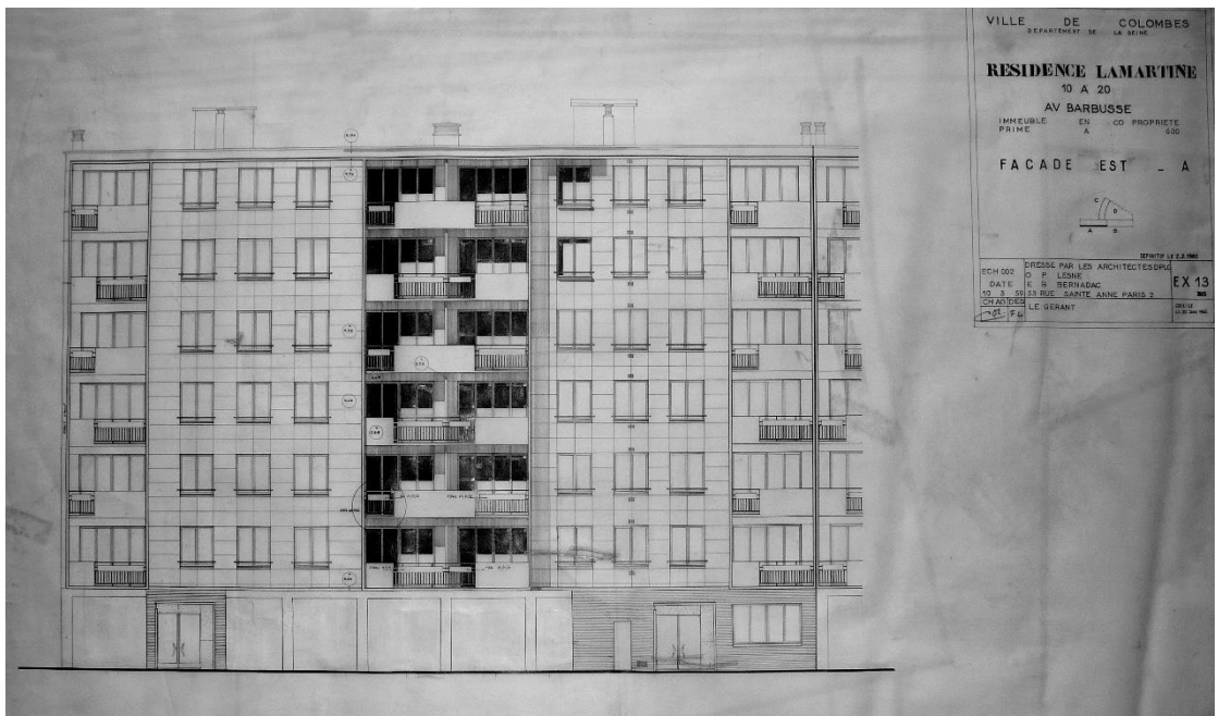
Façade est, calque. Fonds Lesné-Bernadac.