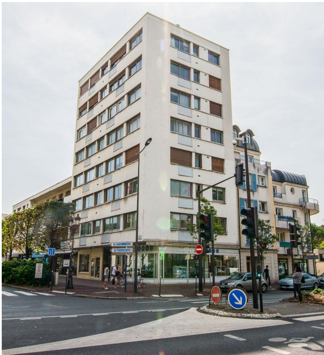
État 2017.