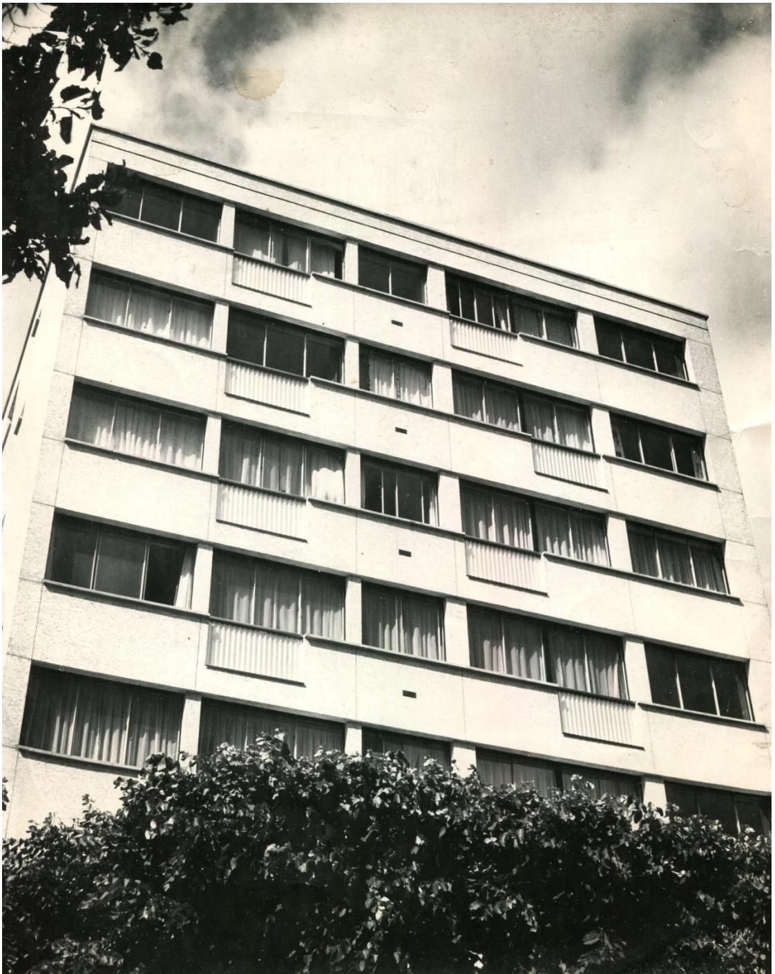
Détail de la façade. Photo d'époque.