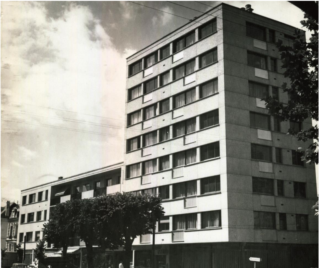
Photo d'époque.